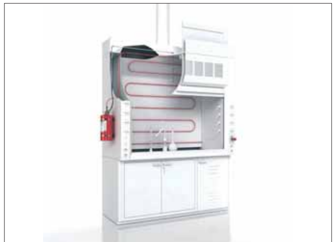
排気キャビネット